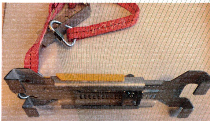
Afbeeldingen 1 - 2: Aanslaginrichting, type B: Dakhaas